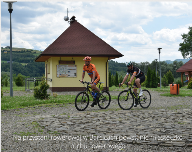
Na przystani rowerowej w Barcicach powstanie miasteczko ruchu rowerowego

FRONT PRAC INWESTYCYJNYCH JEST W TYM ROKU BARDZO SZEROKI. POCZĄWSZY OD TYCH NAJMNIEJSZYCH SPRAW, JAK NOWE WIATY PRZYSTANKOWE, PRZEZ PARKING W BARCICACH I DROGI, AŻ PO POTĘŻNE ZADANIA JAK KANALIZACJA, CZY BUDOWA DROGI W SAG I RONDA W CIĄGU DROGI WOJEWÓDZKIEJ, TO MAMY BARDZO PRACOWITY ROK I KILKADZIESIĄT MILIONÓW ZŁOTYCH ZAANGAŻOWANYCH W ROZWÓJ GMINY I SOŁECTW.