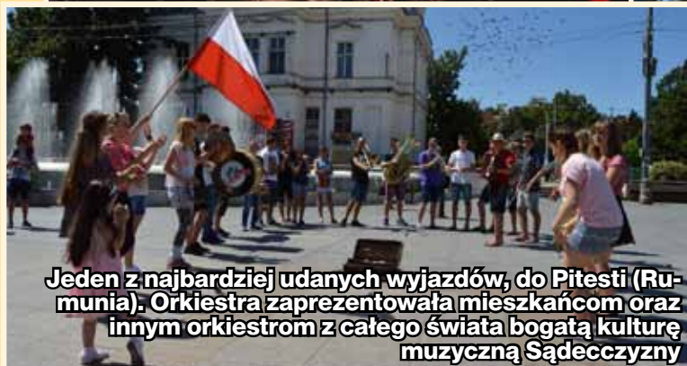
Jeden z najbardziej udanych wyjazdów, do Pitesti (Rumunia). Orkiestra zaprezentowała mieszkańcom oraz innym orkiestrom z całego świata bogatą kulturę muzyczną Sądeczyny