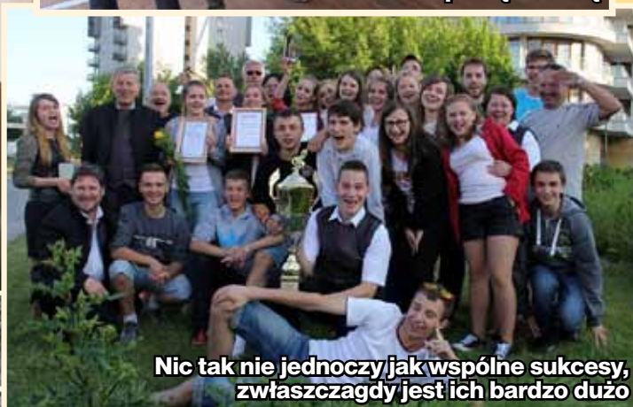
Nic tak nie jednoczy, jak wspólne sukcesy, zwłaszcza gdy jest ich bardzo dużo