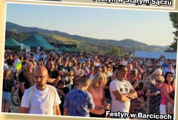
Festyn w Barcicach