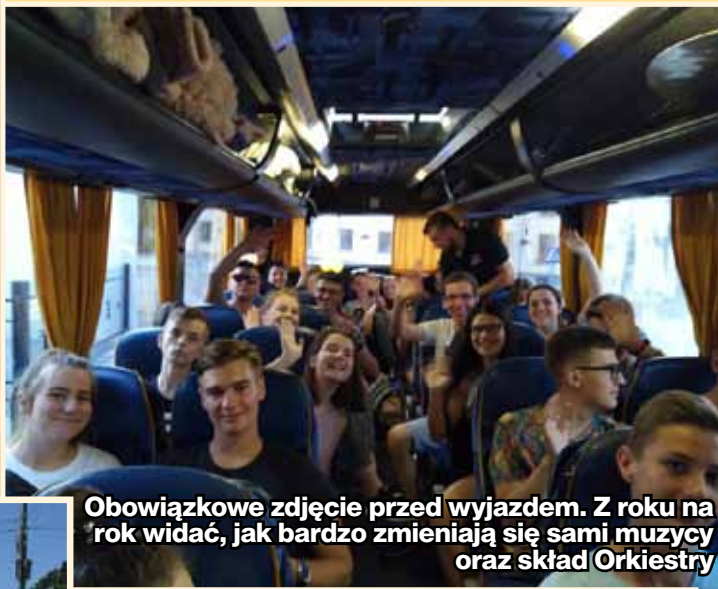
Obowiązkowe zdjęcie przed wyjazdem. Z roku na rok widać, jak bardzo zmieniają się sami muzycy oraz skład Orkiestry