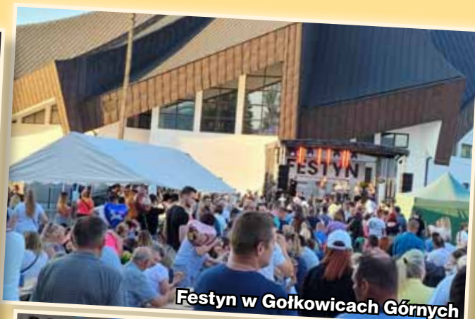
Festyn w Górkowicach Górnych