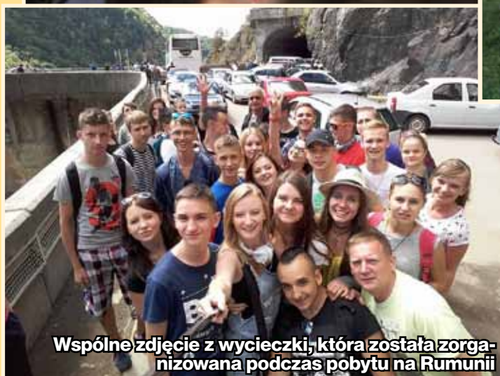
Wspólne zdjęcie z wycieczki, która została zorganizowana podczas pobytu na Rumunii