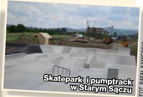
Skatepark i pumptrack w Starym Sączu