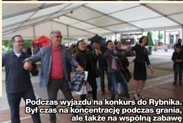
Podczas wyjazdu na konkurs do Rybnika. Był czas na koncentrację podczas grania, ale także na wspólną zabawę