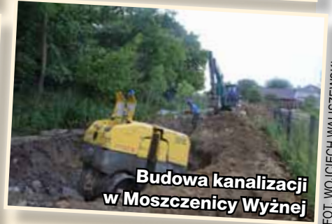
Budowa kanalizacji w Moszczenicy Wyżnej