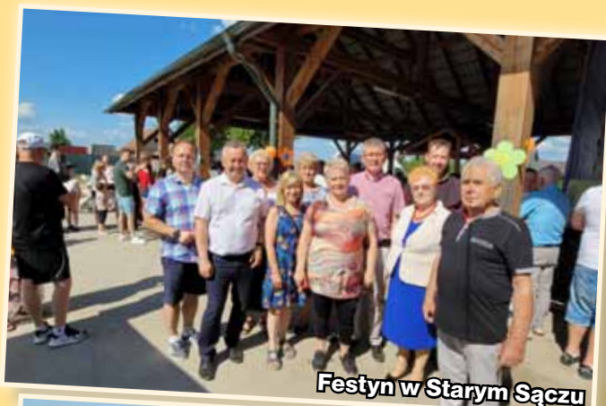
Festyn w Starym Sączu