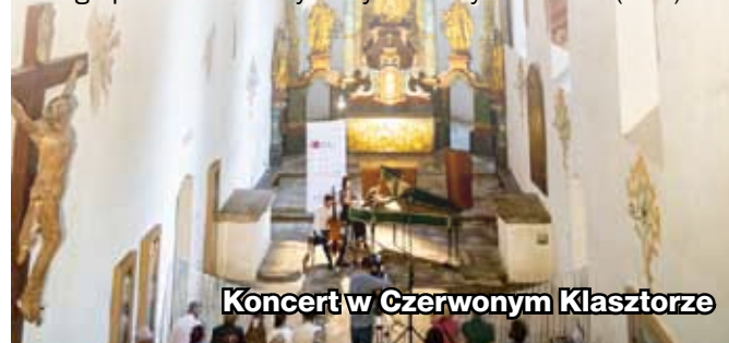
Koncert w Czerwonym Klasztorze

Tegoroczną edycję dofinansowano ze środków Ministra Kultury i Dziedzictwa Narodowego pochodzących z Funduszu Promocji Kultur w ramach programu „Muzyka”, realizowanego przez Narodowy Instytut Muzyki i Tańca. (WW)